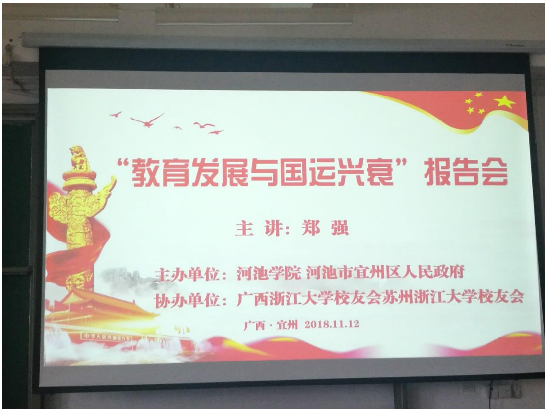
16: 10 比例课件在宽屏投影幕上的显示效果