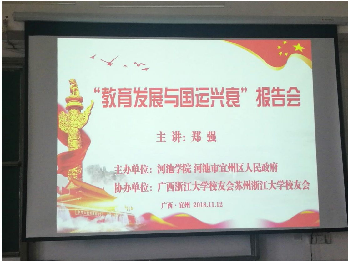
传统 4: 3 比例课件在宽屏投影幕上的显示效果